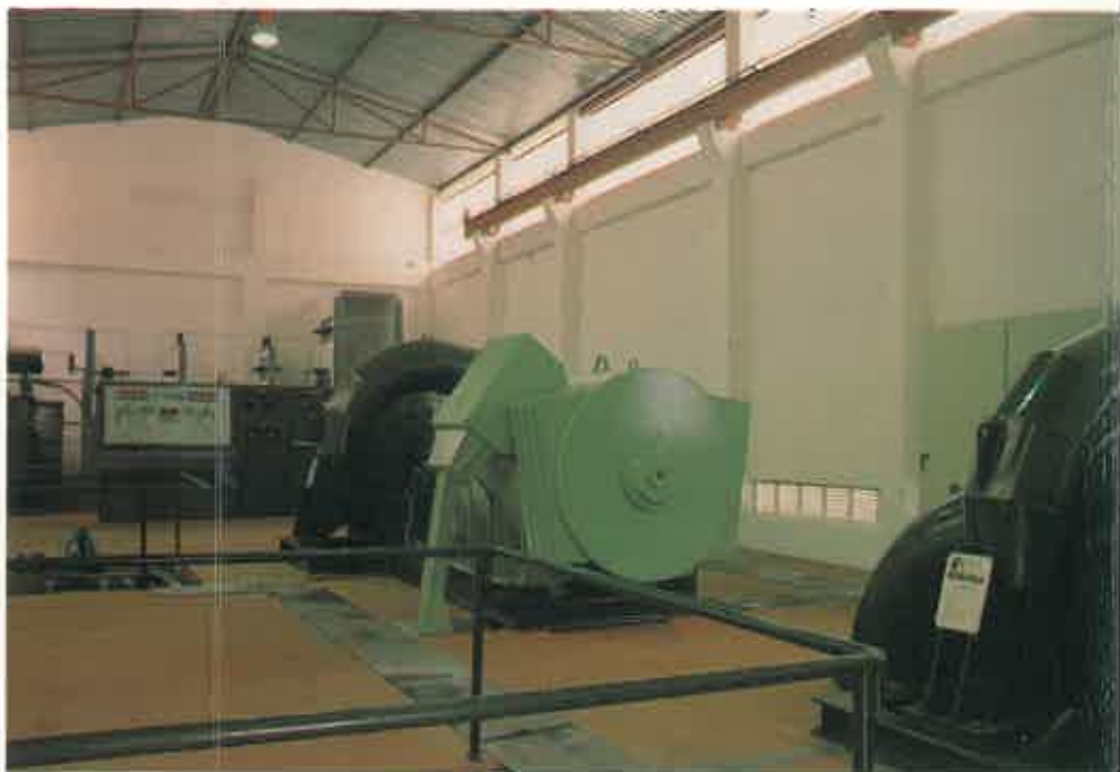
Interior da Central do TEA-I. Covelo (Pontevedra)

Salto neto (mts.): 80,21 Caudal (m. 3 /sg.): 3,22 Potencia (Kw): 1.977 Tensión xer (voltios): 3.000 Tensión saída (V): 15/20.000 Turbinas: Francis horizontal Xeradores: Síncrono trifásico Funcionamento: Automático Producción media anual: 7,9 millóns Kw/h con pluviometría normal